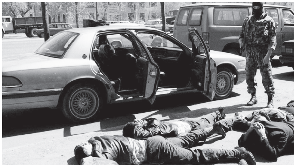
Криминальная обстановка в крае в начале 90-х