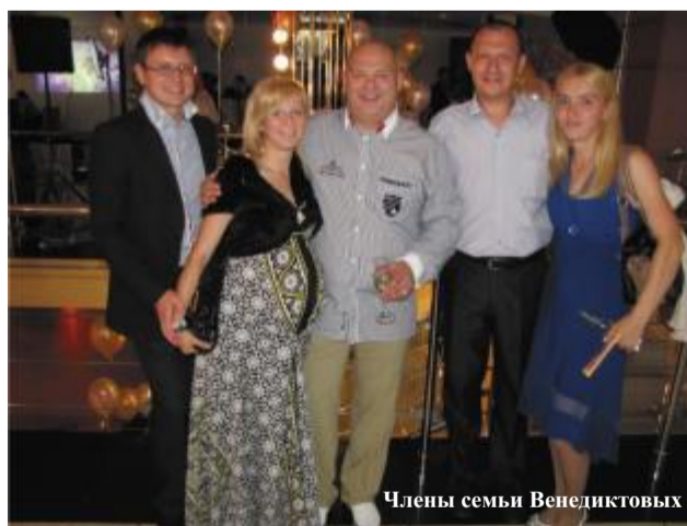
Члены семьи Венедиктовых