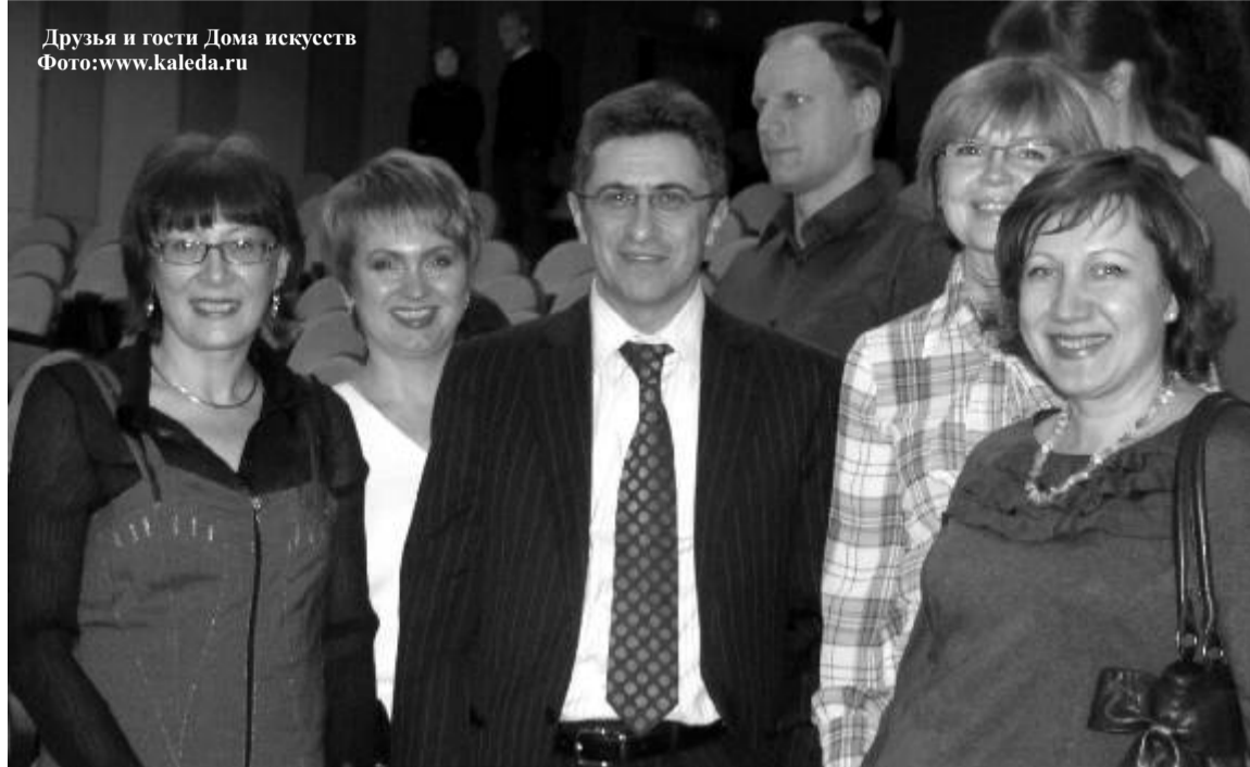
Друзья и гости Дома искусств

С другой стороны, такие проблемы, как низкий уровень информированности и интереса жителей края к творчеству современных профессионалов Красноярского края в области культуры и искусства, влияет на отсутствие краевой культурной идентичности, чувства принадлежности к определенной региональной культуре, которую и формирует творчество этих профессионалов.